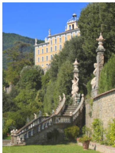
Pescia - Scorcio del Giardino Garzoni

di archi, si trova il Pergamo di Giovanni Pisano, uno dei capolavori della scultura dell'epoca (1298-1301) che colpisce per la drammaticità figurativa. Il pergamo è sorretto da sette colonne di porfido. Di queste, due poggiano su leoni e una su una figura umana