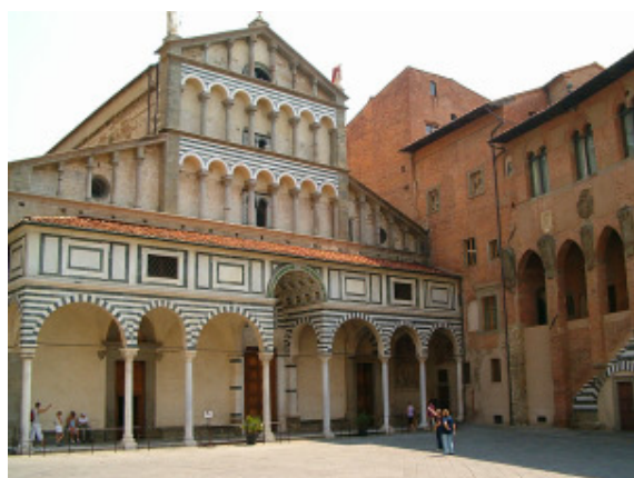
Pistoia - Facciata del Duomo

DUOMO – L'imponente edificio romanico, del XII - XIII secolo ma di origini anteriori al Mille, è fiancheggiato da un notevole campanile coevo alto 67 metri, con logge