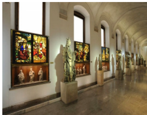
Una sala del Museo del Duomo

Le prenotazioni saranno accolte presso l'Ufficio informazioni di Santa Maria Gualtieri a partire dalle ore 9,00 di martedì 18 marzo.